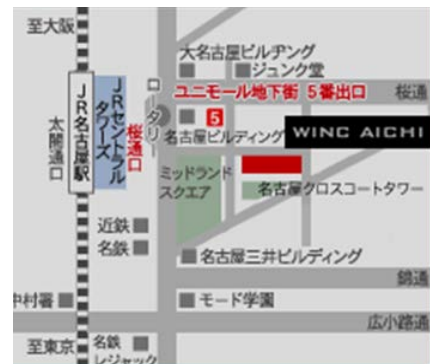
JR名古屋駅桜通口から徒歩5分