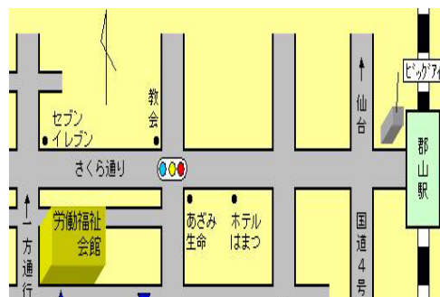
JR郡山駅より徒歩約20分

【申込先】 〒107-0062 東京都港区南青山5-10-5-904 日本ヘルスサイエンスセンター内 健康学習学会事務局 TEL: 03-3409-4025 FAX: 03-3409-4075